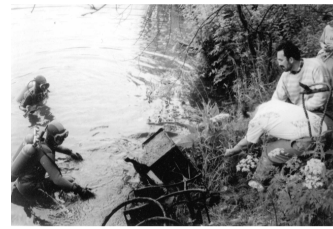
1993: Zusammen mit dem Anglerverein wird aus den Teichen in Roda Müll geborgen und umweltgerecht entsorgt.