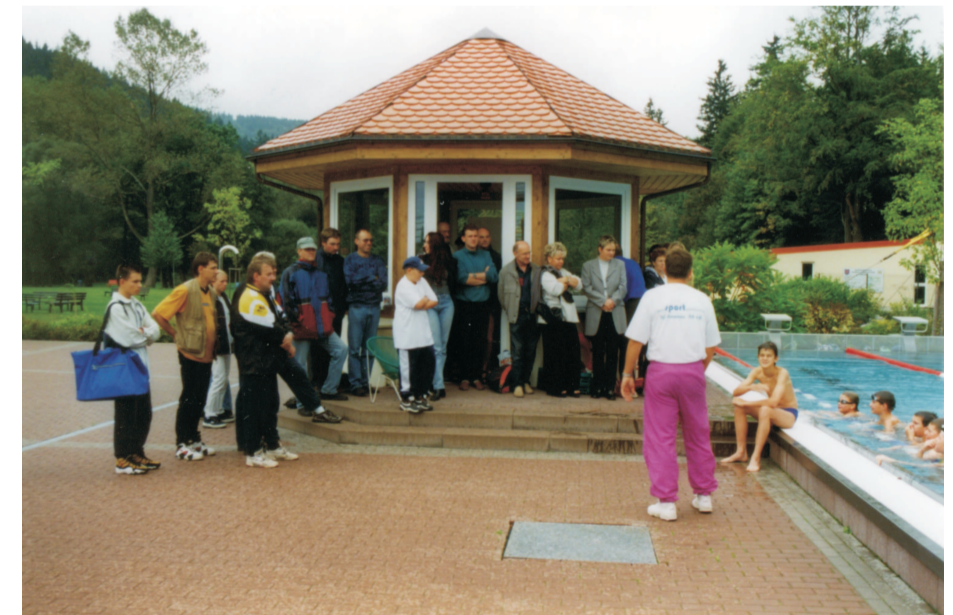
1999: Erster "Sommerwettkampf", nur vereinsintern (W. Schulke)