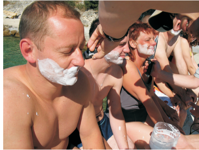
(D. Kapusi 2007)