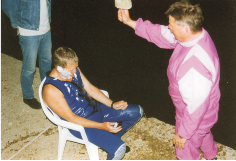
(V. Bornmann 1997)

Von Anfang an wurden die idealen Bedingungen der Bucht von uns für die Tauchausbildung genutzt und die neuen Poseidon-Jünger auf traditionelle Art "getauft".